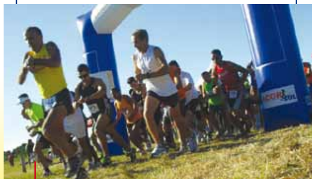
Foto de corrida realizada pela Acorsul

Premiação: 1º a 3º colocados: Categoria masculino, feminino e por idade Medalha de finisher para todos os atletas