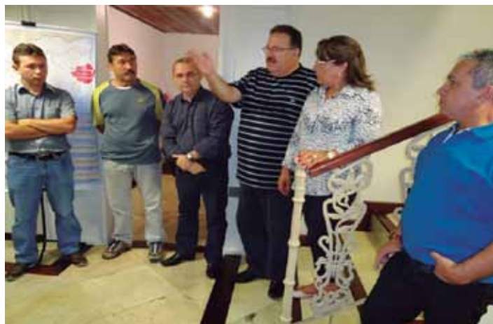
Dirigentes da UGT e dos Sindicatos filiados presentes à inauguração da Macrorregião da Grande Florianópolis

A Macrorregião da Grande Florianópolis funciona junto a Sede da UGT/SC na Avenida Santa Catarina, 1508 no Balneário Estreito em Florianópolis.